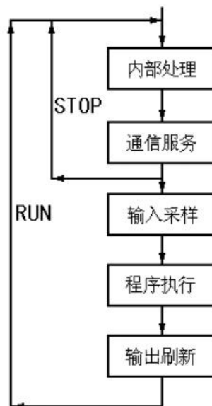
图 2-1 扫描过程示意图

PLC 的扫描工作过程除了执行用户程序外，在每次扫描工作过程中还要完成内部处理、通信服务工作。如图 2-1 所示，整个扫描工作过程包括内部处理、通信服务、输入采样、程序执行、输出刷新五个阶段。整个过程扫描执行一遍所需的时间称为扫描周期。扫描周期与 CPU 运行速度、PLC 硬件配置及用户程序长短有关，典型值为 1~100ms。